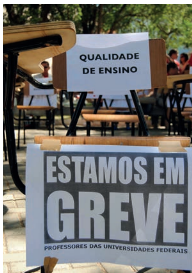
Ato no Piauí durante a greve de 2012

Nos anos 2000, houve a intensificação de políticas de expansão e uma nova reforma universitária. O Programa de Apoio a Planos de Reestruturação e Expansão das Universidades Federais (REUNI), instituído pelo governo Lula a partir do decreto nº 6.096 de 24 de abril de 2007, buscou, considerando as ações previstas no Plano de Desenvolvimento da Educação (PDE/2007) e no Plano Nacional de Educação 2001-2011, ampliar o acesso e a permanência na educação superior, especialmente em cursos de graduação. O REUNI foi uma política pública implementada pelo governo Lula com a finalidade de interiorizar o ensino superior público federal se