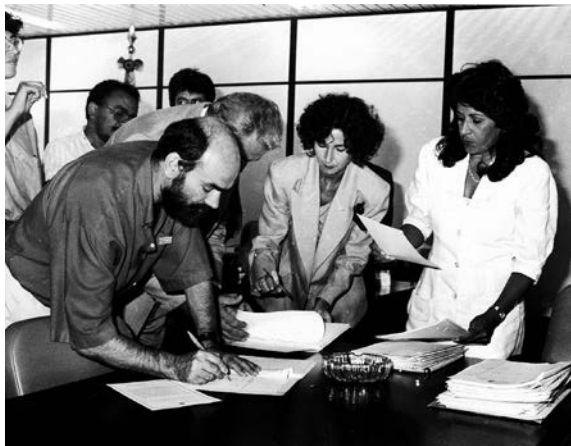
Assinatura do registro sindical do ANDES-SN em 1990

de uma lei nacional de diretrizes e bases para a educação nacional. Desde a sua elaboração, o projeto passou por diversas atualizações e sua última versão foi publicada em 2013 1 .