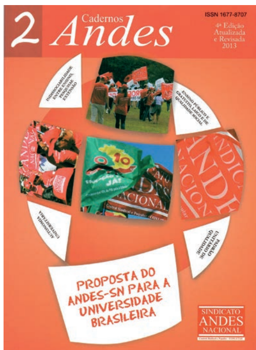
Capa do Caderno 2 do ANDES-SN

Ainda em 1982, preocupada em discutir a questão da Universidade com outros setores da sociedade, a ANDES articulou-se com a Sociedade Brasileira para Pesquisa e Ciência (SBPC), Ordem dos Advogados do Brasil (OAB) e a Associação Brasileira de Imprensa (ABI). Em reunião realizada no Rio de Janeiro, o(a)s presidentes e/ou representantes destas quatro entidades formaram um acordo de ação comum no sentido de encaminhar proposições sobre a reestruturação da Universidade Brasileira, com base nos seguintes princípios: