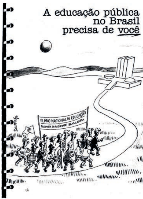
Capa do Plano Nacional de Educação da Sociedade Brasileira (PNE-SB) de 1990

Pública; apresentou propostas para a Lei de Diretrizes e Bases da Educação Nacional (LDB), a partir da organização das entidades da educação, que acabaram sendo desconsideradas quando da aprovação da lei em 1996; e, posteriormente, no final da década de 1990, elaborou o Plano Nacional de Educação da Sociedade Brasileira (PNE-SB), que reivindicava aumento do orçamento da educação pública, defendia a educação 100% pública e estatal, a liberdade de cátedra e a democratização do ensino superior, entre outros. Ainda na década de 1990, o ANDES-SN teve papel de destaque na luta contra as privatizações, tanto na educação quanto em outras áreas das políticas públicas e sociais.