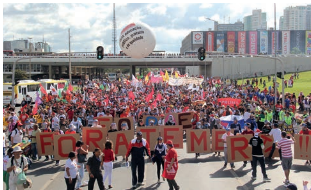
#OcupaBrasília em 2017

O setor das federais do ANDES-SN tem tido importante papel na articulação do(a)s docentes para a disputa dos