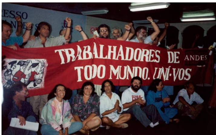
Durante o 10º Congresso do ANDES-SN, em Curitiba (PR), docentes aprovaram a filiação à Confederação de Educadores Americanos (CEA)

docentes com filho(a)s nos espaços deliberativos e formativos. Desde o 36º Congresso, realizado em 2017 em Cuiabá (MT), o ANDES-SN tem uma Comissão de Combate ao Assédio. Finalmente, houve um grande avanço a partir do 38º Congresso, com a aprovação da paridade de gênero na diretoria nacional, outra política importante na luta contra o machismo no movimento sindical.