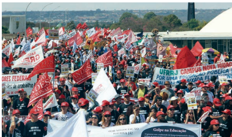
Servidores federais em greve realizam marcha unificada em Brasília - 2012

Esses três pontos possibilitaram articular docentes das mais diversas instituições em todo o país. No setor privado, com a ampliação das incursões do capital sobre a educação, intensificada a partir da ditadura civil-militar, o movimento docente avançou muito a partir da segunda metade da década de 1980 por meio de lutas contra o arrocho salarial e por melhores condições de trabalho. Sendo uma alternativa combativa aos SINPRO (que