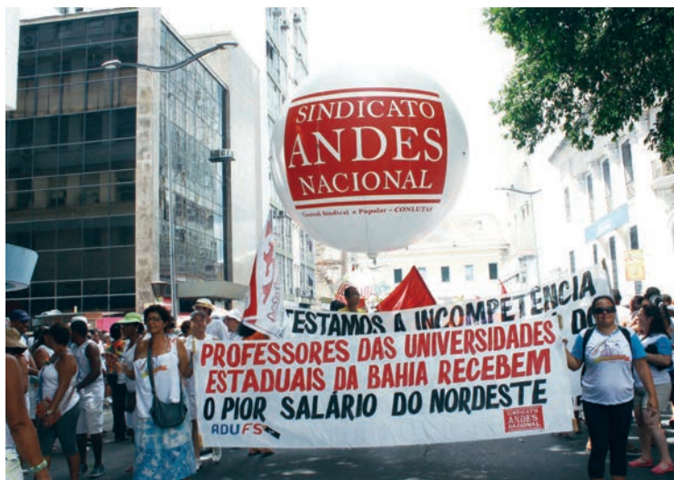
Manifestação na Lavagem do Bonfim em Salvador (BA) em 2013

sua sede administrativa foi constituída em Salvador, onde funcionava a Faculdade de Educação.