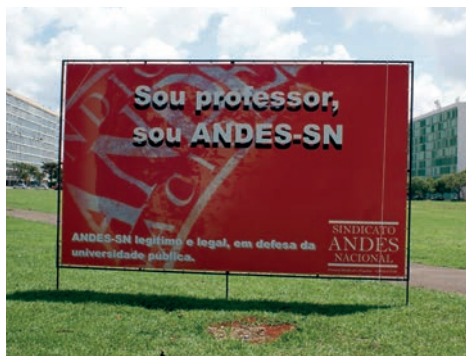
Ato em defesa do ANDES-SN em frente a Esplanada dos Ministérios, em Brasília, em 2010

Como sindicato nacional, o ANDES-SN possui estatuto próprio e a partir deste as seções sindicais organizam seus regimentos. Como expresso no artigo 2º do estatuto, o “ANDES-SN tem por finalidade precípua a união, a defesa de direitos e interesses da categoria e a assistência à(o)s seus (suas) sindicalizado(a)s”. Portanto, o ANDES-SN se constitui, segundo o artigo 3º, como “entidade democrática, sem caráter religioso