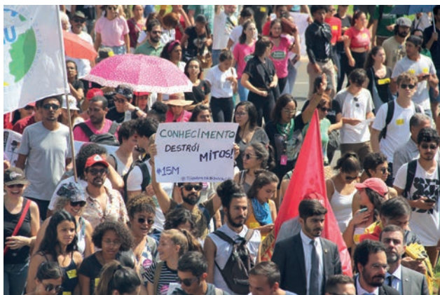
15 de maio, primeiro tsunami da educação em 2019

em torno da figura de Jair Bolsonaro e elegeram a educação pública e gratuita como um de seus principais inimigos. Apesar da situação política, o evento, ocorrido em Brasília,