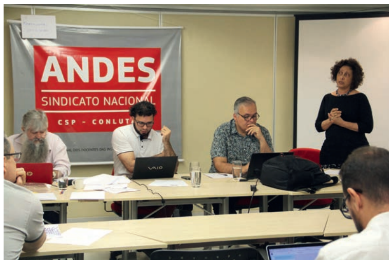
Reunião conjunta dos setores, realizada em 2019

O Sindicato Nacional na década de 2000 enfrentou um novo desafio: a expansão universitária e com ela a organização sindical no universo da multicampia, o que já era uma realidade para as IEES/IMES, tornou-se uma característica das Instituições Federais. Os espaços de debate sobre