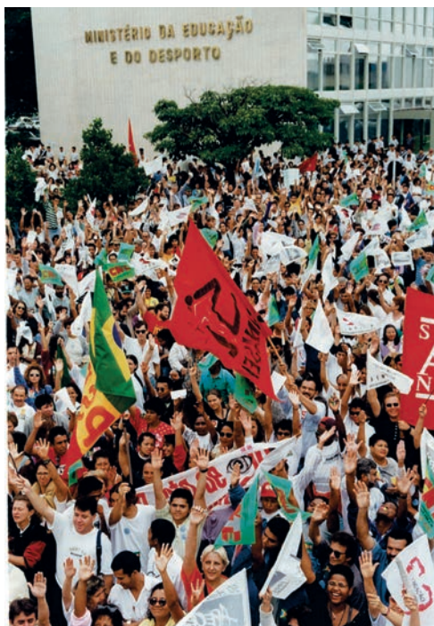
Ato em frente ao MEC - 1995

Já como Sindicato Nacional, o ANDES-SN participou ativamente da luta contra o projeto neoliberal iniciado no Brasil a partir do governo de Fernando Collor de Mello (1990-1992) e intensificado nos governos de Fernando Henrique Cardoso (1995-2002), quando se instaurou um profundo ataque aos serviços e servidore(a)s público(a)s, com congelamento de salários, privatizações, terceirização, suspensão de concursos públicos, desestruturação dos direitos sociais, entre outros.