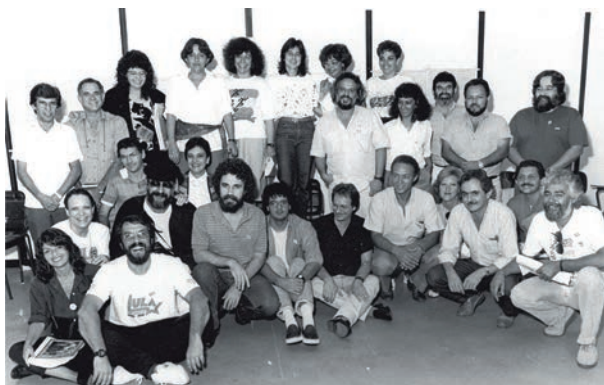
Docentes em luta pela carreira única em 1988

No ANDES-SN as deliberações são tomadas a partir das pro-