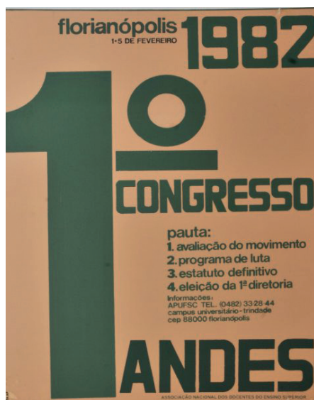
1º Congresso da ANDES

Em 19 de fevereiro de 1981, após a realização do III Encontro Nacional de Associações Docentes, durante o Congresso Nacional de Docentes Universitários realizado em Campinas (SP), com a participação de 317 delegado(a)s inscrito(a)s e 67 AD ou Comissões pró-AD, foi fundada a Associação Nacional dos Docentes das Instituições de Ensino Superior (a ANDES). A ANDES foi uma entidade criada para defender e representar o(a)s docentes de todo o país sem se submeter ao Ministério do Trabalho e à sua ditadura sobre o(a)s trabalhadore(a)s. Por isso, desde o início, a ANDES representou trabalhadore(a)s em seus locais de trabalho e priorizou, em detrimento do imposto sindical, a sua autossustentação financeira.