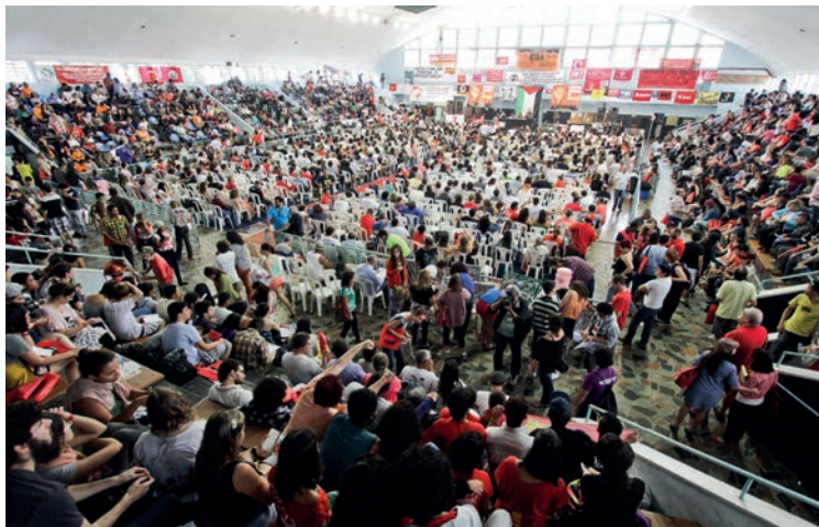
I ENE, realizado no Rio de Janeiro, em 2014

do setor, foi criado o “Comitê Nacional em Defesa dos 10% do PIB para Educação Pública Já!”, responsável pela realização de um plebiscito que teve por título sua consigna e que, somente no primeiro ano, contou com a participação de 360 mil pessoas, das quais 352 mil votaram favoráveis ao aumento do financiamento da educação.