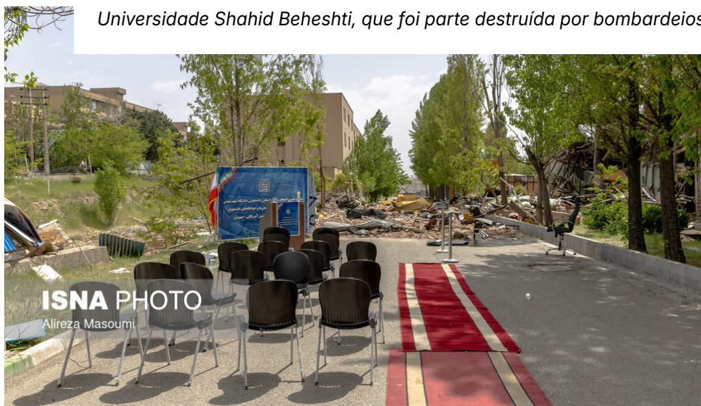
Universidade Shahid Beheshti, que foi parte destruída por bombardeios